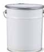
Secchi per miscelazione