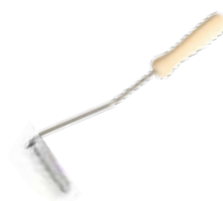
Rullino a pelo corto