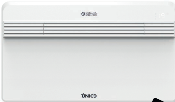
Design by Matteo Thun & Antonio Rodriguez