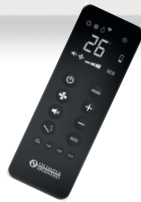
Telecomando di serie

Due modalità di connessione e tutta la sicurezza del cloud by Olimpia Splendid